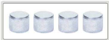
千分尺研磨块 (型号6307-1, 选配)